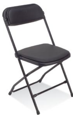
■ Polyfold black plus