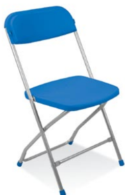
■ Polyfold alu