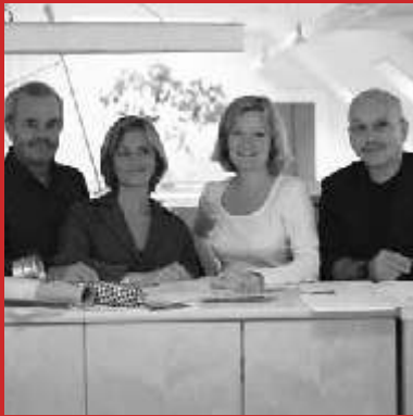
Pelikan & Co, Denmark

De naam zegt het al: brochure-standaard Six Pack is voorzien van zes presentatievlakken. Doordat deze diagonaal tegen de 'stam' zijn geplaatst doet de door Pelikan & Co. ontworpen standaard enigszins denken aan een boom. Six Pack in serie is dan vanzelf een bos.