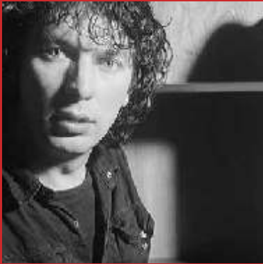
Toon van Tuijl, The Netherlands

Door de manier waarop de schappen zijn geplaatst, heeft Hi Five iets van het aloude muizenrapje. Maar dankzij het bijna transparante metalen frame staat het ontwerp van Toon van Tuijl opvallend stabiel. Waardoor alle aandacht gaat naar de brochures, boeken of tijdschriften die op de standaard geplaatst kunnen worden.