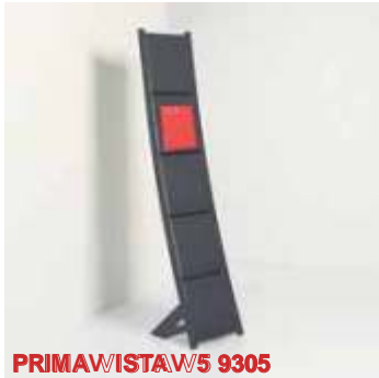
PRIMAVISTA W5 9305