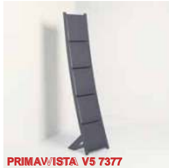
PRIMAVISTA V5 7377