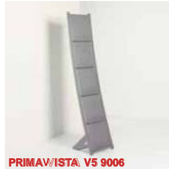
PRIMAVISTA V5 9006